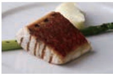
Today's Grilled Fish