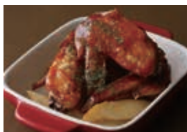
Buffalo Chicken Wings