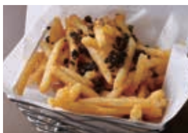
Truffle French Fries