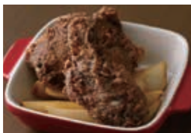
Original Pepper Fried Chicken