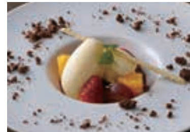
New York Cheese Cake