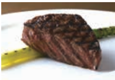
Wagyu Beef Tenderloin