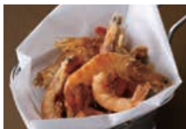
Deep Fried Cajun Shrimp