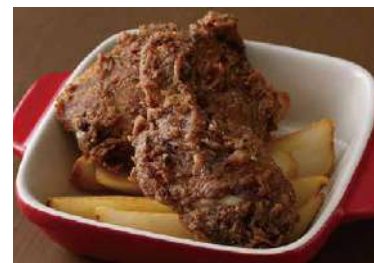
Original Pepper Fried Chicken