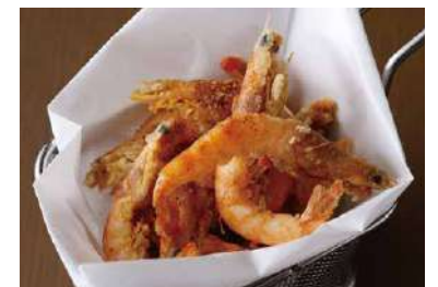
Deep Fried Cajun Shrimp