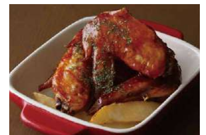
Buffalo Chicken Wings