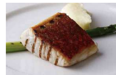
Today's Grilled Fish