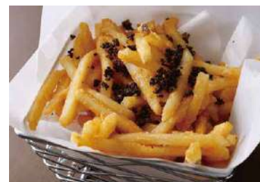
Truffle French Fries