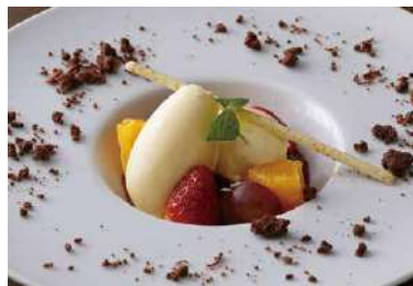
New York Cheese Cake