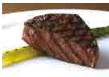
Wagyu Beef Tenderloin

Grilled Prawns (3 pieces) 3,300 グリルシュリンプ 3尾