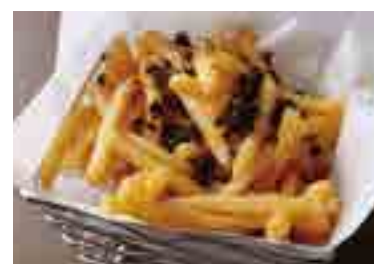
Truffle French Fries