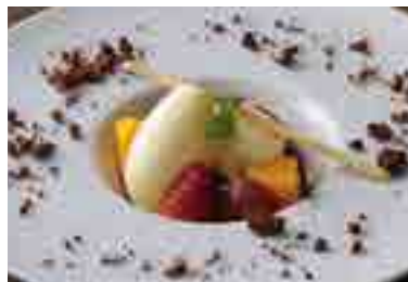
New York Cheese Cake