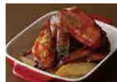
Buffalo Chicken Wings