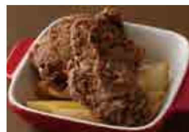
Original Pepper Fried Chicken