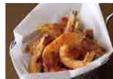
Deep Fried Cajun Shrimp