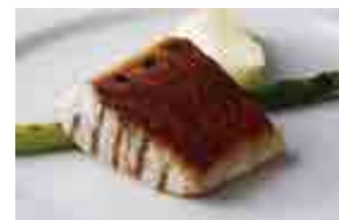
Today's Grilled Fish