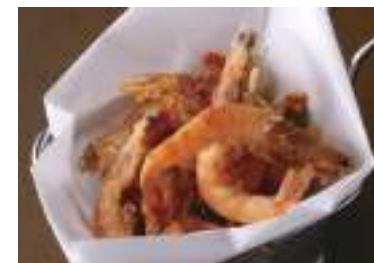
Deep Fried Cajun Shrimp