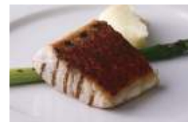
Today's Grilled Fish