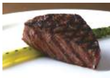
Wagyu Beef Tenderloin

Grilled Prawns (3 pieces) 3,300 グリルシュリンプ 3尾