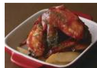
Buffalo Chicken Wings