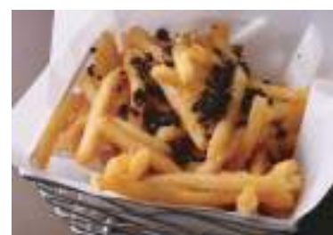
Truffle French Fries