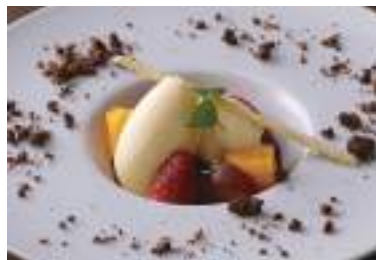
New York Cheese Cake