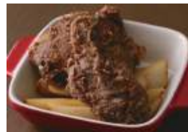
Original Pepper Fried Chicken