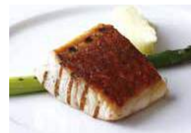
Today's Grilled Fish