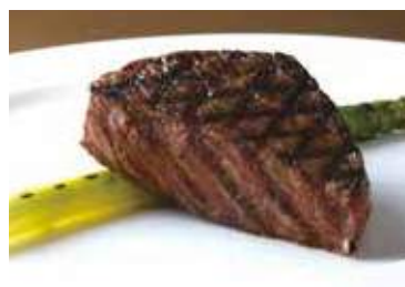
Wagyu Beef Tenderloin

Grilled Prawns (3 pieces) 3,300 グリルシュリンプ 3尾