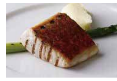
Today's Grilled Fish