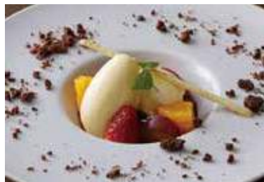
New York Cheese Cake