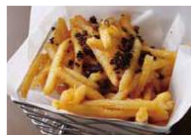
Truffle French Fries