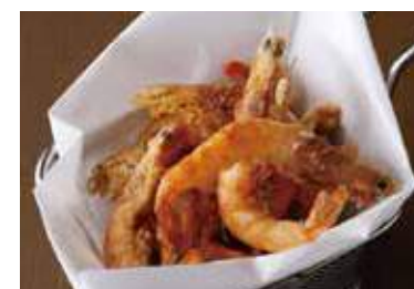
Deep Fried Cajun Shrimp