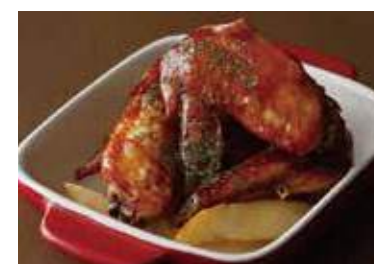
Buffalo Chicken Wings