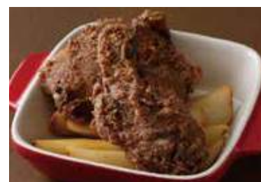
Original Pepper Fried Chicken